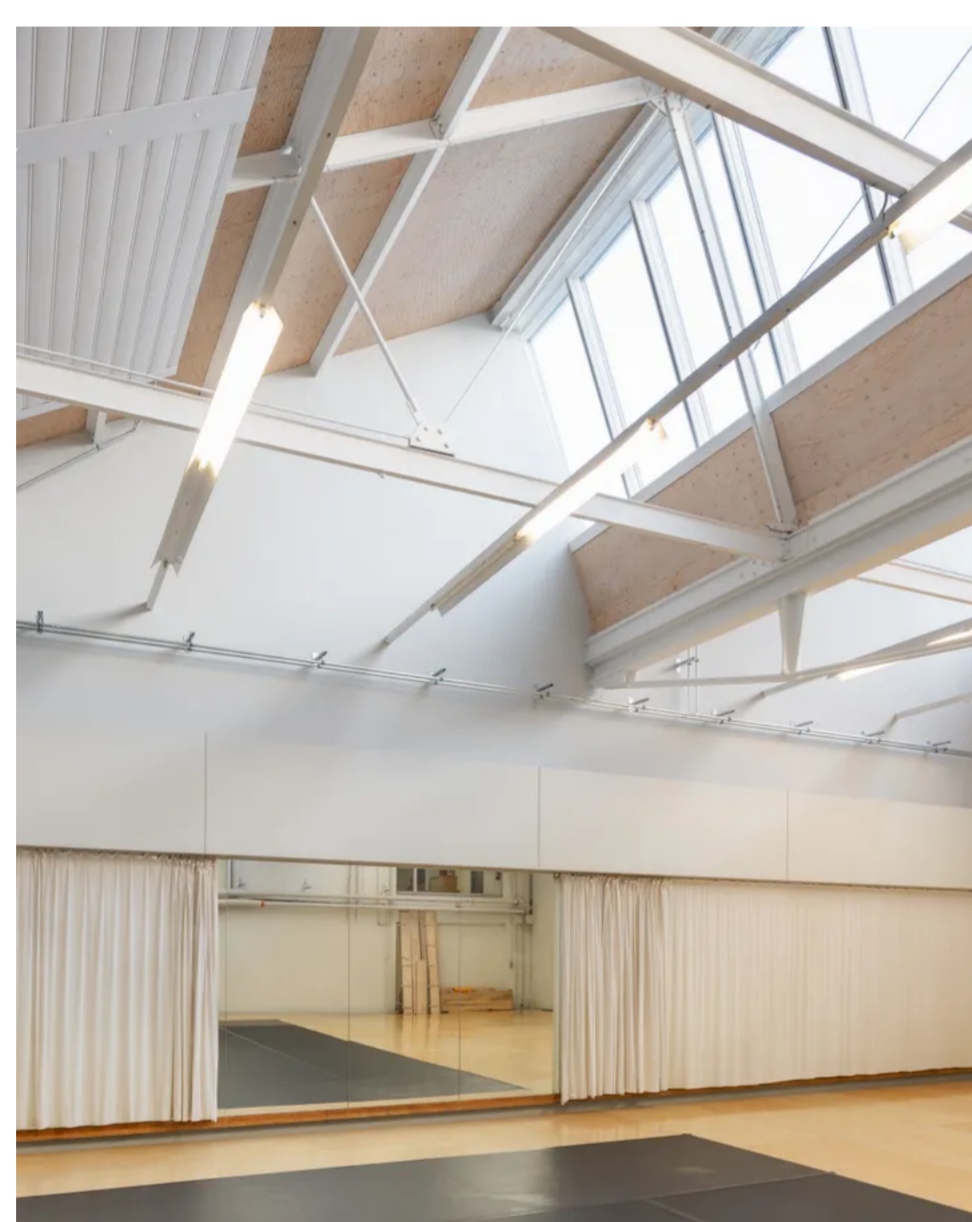
De vernieuwde dansruimtes op de site.

Daarnaast zijn er workshops voor verschillende leeftijden. Kinderen vanaf 2 jaar zijn welkom om hedendaagse dans spelenderwijs te verkennen via fantasierijke improvisatie. Volwassenen en professionals worden door Rosas-danseres Laura-Maria Poletti meegenomen in de wereld van Rosas danst Rosas .